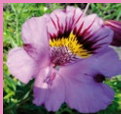
LIRIOS DEL CAMPO