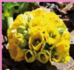
GARRA DE LEÓN AMARILLA