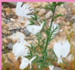
MARIPOSA BLANCA O CACATÚA