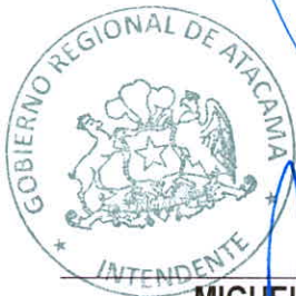
MIGUEL VARGAS CORREA INTENDENTE REGIONAL GOBIERNO REGIONAL DE ATACAMA