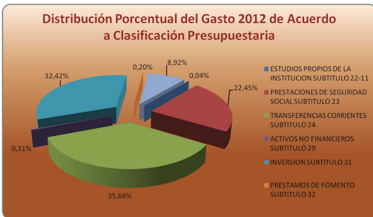
Grafico N° 2: Distribución del PROPIR 2012 de Acuerdo a la Clasificación Presupuestaria.

subtitulo 33 representando un 8,92% y están referidas a Subsidios habitacionales, pago de concesiones aeroportuaria, programas para formación de capital tales como Fondo Innovación para la Competitividad (FIC), apoyo a micro emprendimientos, empleabilidad juvenil, programas de desarrollo humano, entre otros, se destaca, el SERVIU, Aeronáutica Civil, CNR, INDAP y FNDR. En relación a la adquisición de Activos no Financieros subtitulo 29, estos tiene una incipiente participación (0.31%) y responden principalmente a las instrucciones específicas sobre materia de inversión de la Dirección de Presupuesto. (Circular N° 33), se destaca la Aeronáutica Civil, SERNAGEOMIN y FNDR. Las transferencias por Préstamos corresponden al 0,20% que realiza INDAP y FONASA.