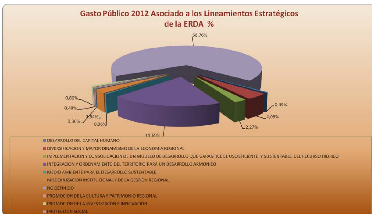
Grafico N° 1: Distribución del Propir 2012 Asociado a los Lineamientos Estratégicos.

De acuerdo a clasificación presupuestaria, el PROPIR 2012 está conformado por los subtítulos 22-11, 23, 24, 29, 31, 32 y 33. La distribución de este mismo está marcada por las transferencias corrientes subtítulo 24 que concentra un 35,66% del total PROPIR 2012, en esta oportunidad EDUCACION es el sector con mayor presencia principalmente con la ejecución de las subvenciones y bonificaciones; le sigue el Servicio de Salud, JUNAEB, SENAME, CORFO y la Seremi de Salud. En segundo término el 32,42% se destina al subtítulo 31 iniciativas de inversión que contempla principalmente obras civiles, conservación de infraestructura, estudios y programas, se destacan VIALIDAD, FNDR, y el Servicio Salud Atacama. Las prestaciones de Seguridad Social subtítulo 23 representan el 22,45%, cuyas iniciativas se enmarcan dentro de las prestaciones previsionales, de asistencia social y subsidios; se destacan el IPS, FONASA, CAPREDENA, Seremi de Salud y el ISL. En cuarto término se ubican las transferencias de capital