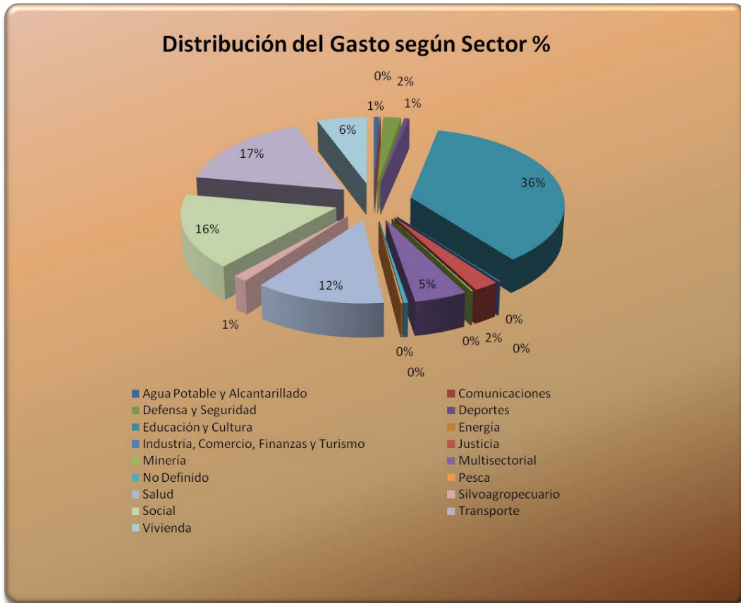
Gráfico N°5: Distribución Porcentual de la Inversión en la Región de Atacama según el Sector.

proyectos de Construcción, Reparación y Conservación de caminos. El sector Social con una 16,05% ocupa un tercer lugar dentro de esta distribución con el importante aporte del Ministerio del Trabajo y Previsión Social, Instituto de Previsión Social con las prestaciones de asistencia social. En la cuarta posición se destaca Salud con una participación de un 12,41%, la mayor inversión la concentra el ministerio de Salud, destacando el Servicio de Salud Atacama con la Normalización del Hospital Regional y Fonasa con la venta de libre elección y el déficit que cubre de la CCAF.