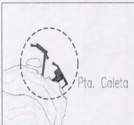
Plano General de la Solicitud